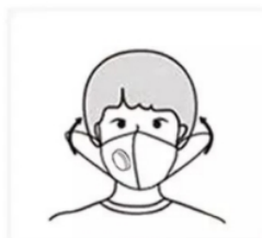
UZLIECIET MASKU UN PIELĀGOJIET AUSU AUKLAS